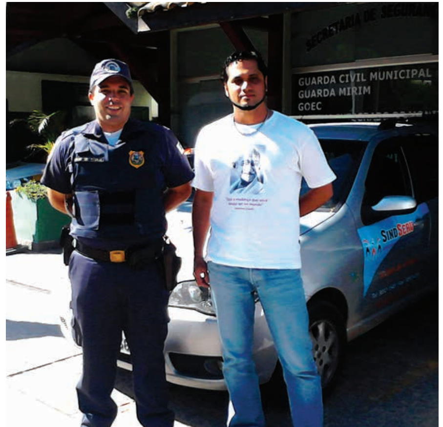
Servidor após retorno em 4 de julho

“Graças ao empenho do Sindserv eu consegui voltar à atividade laboral que tanto gosto e me faz feliz. Gostaria que os servidores enxergassem minha história como um exemplo, e entendessem realmente o valor